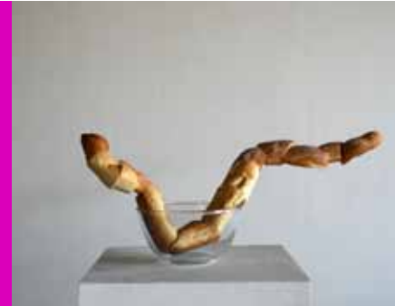
ikebana pain, ongles, verre

- Oui, on peut le dire comme ça, c'est un éclectisme des moyens, pas des fins [elle passe les mains dans ses cheveux].