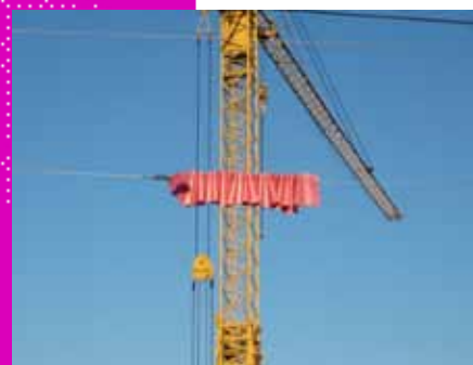
sirtaki tirage numérique 120 x 80 cm