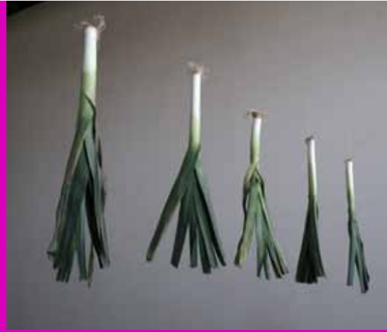
installation in-situ poireaux suspendus, miroir, pochoirs dimension variable