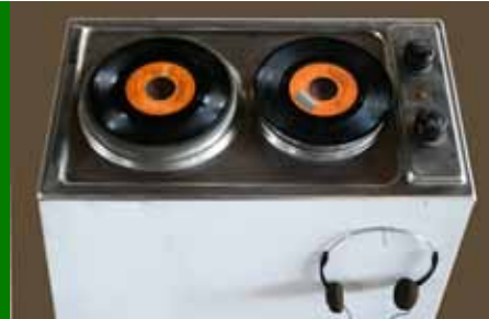
thu thu thu plaque électrique, double 45 tours